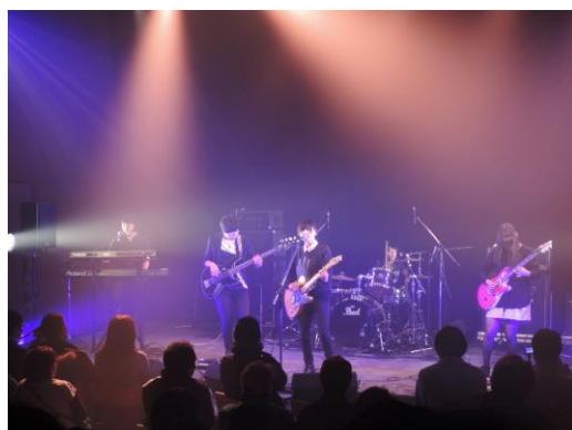
Plug and Pray