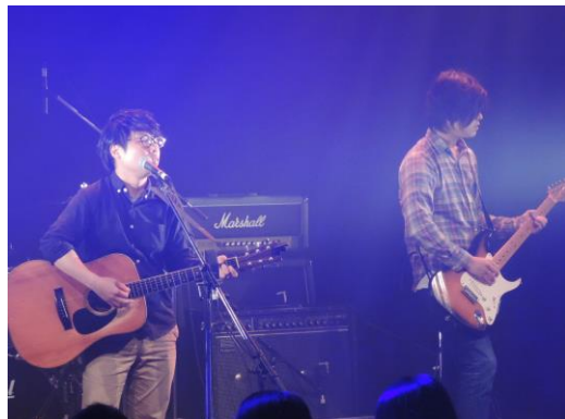
The enter tonic