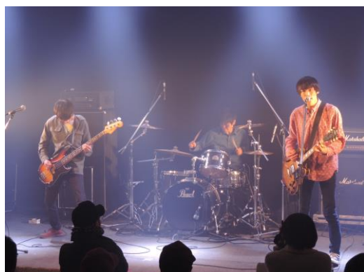
イカスタンジャケット