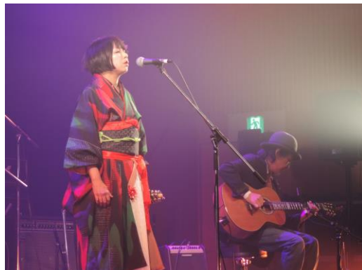
Hiddy & Satty